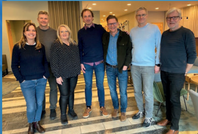
Ledere fra de fire nordiske lande

Vi samarbejder i flere lande og i flere forskellige tematiske områder, f.eks. uddannelse og inklusion af særligt sårbare børn i skoler; psykologisk og social støtte til udsatte befolkningsgrupper og flygtninge i Ukraine; freds- og forsoningsarbejde i Afrika, hvor der er religiøse spændinger og terrorisering af religiøse mindretal. Gennem samarbejdet med de samme partnerorganisationer og kirker i Syd, kan vi også blive mere effektive og skabe synergier, der på sigt styrker os alle og at vi undgår overlaps og duplikering af indsatserne.