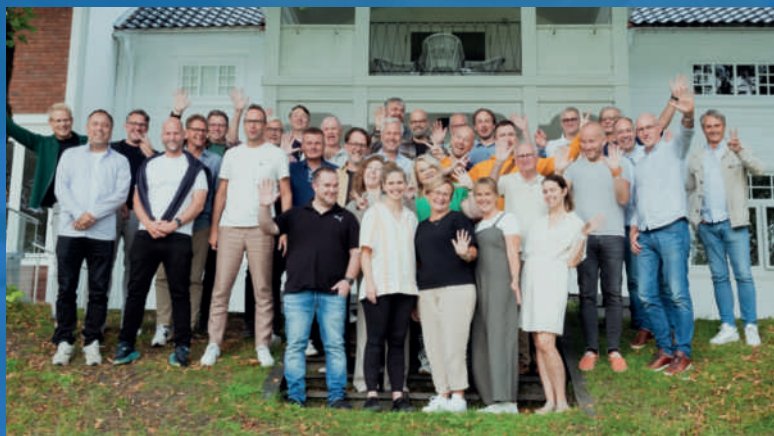
The HUB gruppen i orden